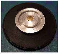
????????? ?? ?????????????? ?????? KEIHIN 1 (4803)